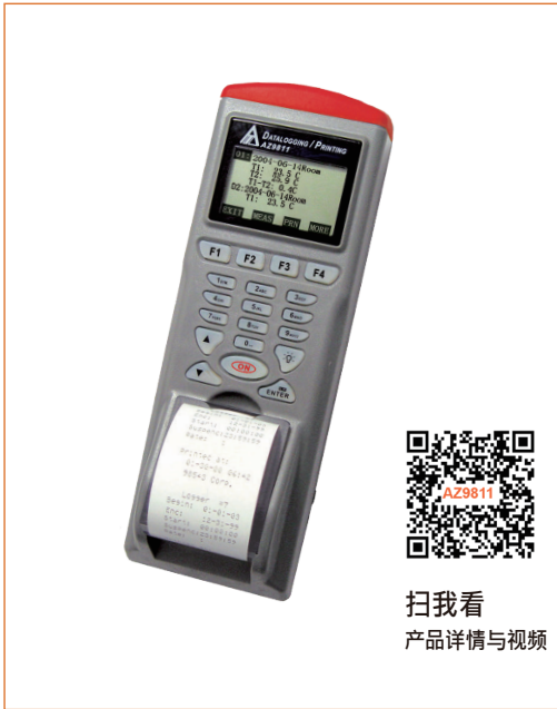
扫我看 产品详情与视频